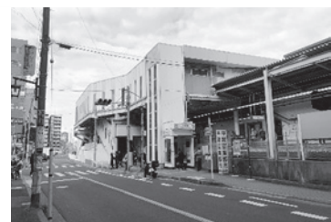
より便利な南口に

日 色 JR西船橋駅南口周辺は公共施設等も乏しい。この地域の課題について、地域住民の声を聞くなどして、整備に取り組んでもらいたい。