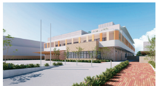
児童相談所の外観イメージ

このたび市は、「船橋市児童相談所基本設計の概要」を公表しました。JR南船橋駅南口の市有地に市独自の児童相談所を設置するもので、開所は令和8年4月を予定しています。目指す姿は「船橋の全ての子どもの安全で安心な生活を守り 健やかな成長と発達を切れ目なく支援する拠点」とされています。設置に向けては、人材の確保など多くの課題がありますが、事業の円滑な実施を見守りたいと思います。