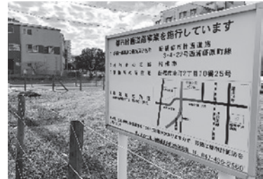
新たな工法の検討を

日 色 地権者の立場も考えれば、すぐに動けるものではないと思うが、何らかのアクションをお願いしたい。最も問題となっているのは、京葉道路を高架で越える計画となっていることだが、本当に現実的だろうか。京葉道路の下をくぐるアンダーパス工法が採用できれば地権者の理解も得やすいのではないか。時間の経過とともに、技術の進展も期待できる。新たな工法も検討されるよう要望する。