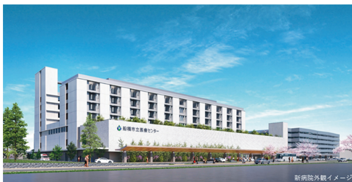
新病院外観イメージ

去る10月11日（水）、令和5年第3回定例会（9月議会）は市長提出の12議案および決算認定10件他を議決し閉会しました。今回の9月議会では、本年3月に基本設計が公表された船橋市立医療センターの建て替えについて、必要な経費に充てるための整備基金を設置する条例が可決されたほか、高騰する工事費やその立地等をめぐって多くの議論がなされました。私も9月21日（木）に行われた一般質問において取り上げ、市執行部と議論を行いました。