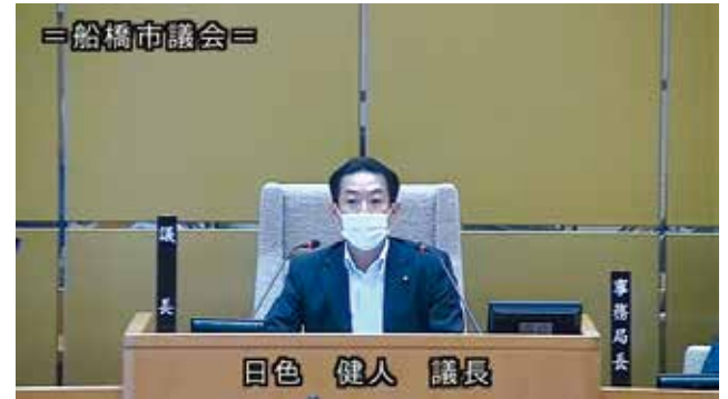
議場も全員マスク着用

同僚議員の皆さんのご理解と議会事務局の皆さんのお支え、市執行部の協力を得て、引き続きこの難局を乗り越えて市民生活の向上のために努力する所存です。市民の皆様のご理解とご支援を心からお願いいたします。